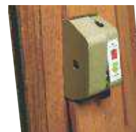
Pivot avec arrêt à 25° et blocage à 180° par bouton poussoir