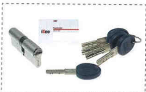
B2 BARILLET DE SÉCURITÉ - 5 CLÉS CARTE DE RÉAPPROVISIONNEMENT