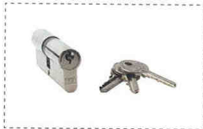
B1 BARILLET STANDARD