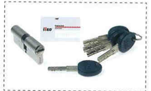
B2 BARILLET DE SÉCURITÉ - 5 CLÉS CARTE DE RÉAPPROVISIONNEMENT