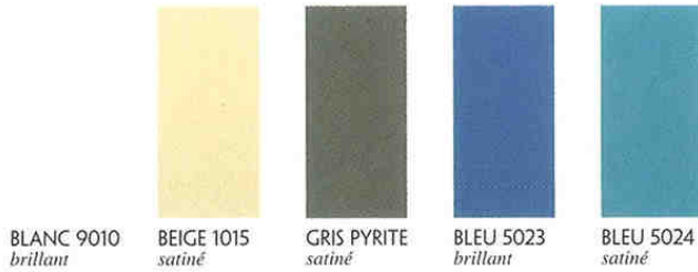
BLANC 9010 brillant